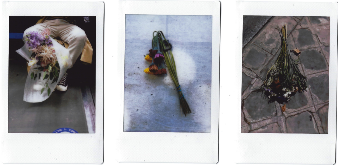
Peau-pourrie, série de photographies instantanée 2020 à 2022

En explorant des quantités de genres, des variétés de sujets, mes choix photographiques s'inspirent souvent de mes expériences. À travers, mes notes et mes photographies, je perçois l'importance accordée au temps. Prendre le temps de se déplacer, d'être seule, d'observer. Avec mon appareil, je dénicher autant beauté dans la perfection que dans le difforme, je me saisis d'objets que la plupart ignorent. Sur mes photos, les poubelles débordent de fleurs et les jardinières croulent sous des cascades de déchets. Chaque petite image devient l'évènement marquant d'un rituel de la vie. J'ai collectionné des clichés de bouquet périmés dans un monde où la photographie fane dans nos pellicules de téléphone. La photographie comme tout n'est plus unique, la rareté d'un moment n'existe plus.